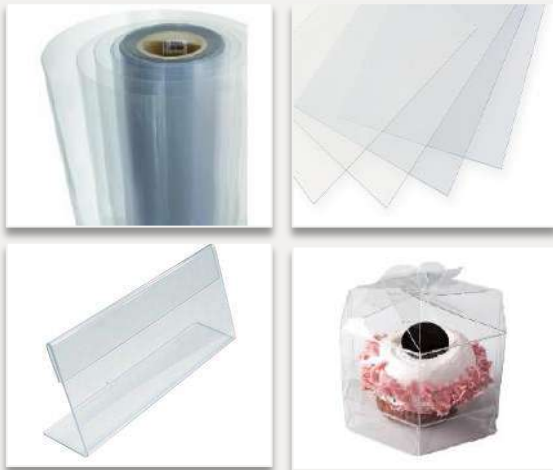
PET, PVC, BOPET, BOPP Rígido y Flexible Transparente