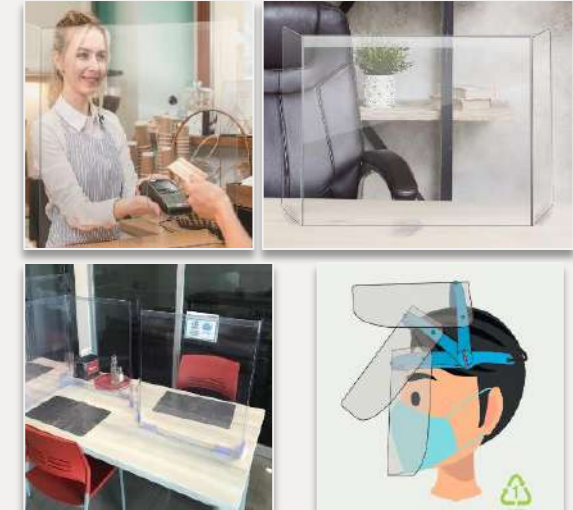
Barreras de Protección Personal