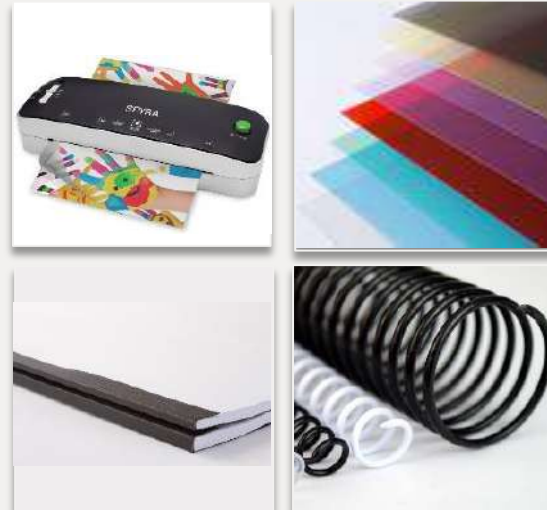
Presentación y Protección de documentos